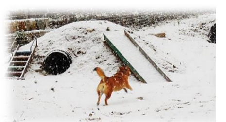
ドッグラン 冬と春