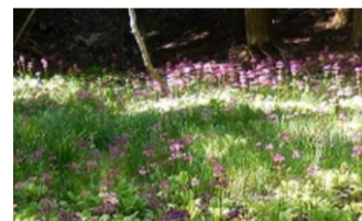
クリンソウ 湿原に自生する サクラソウの一種。 千種高原は、日本でも 珍しい群生地