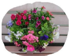
ハンギングバ スケットの花