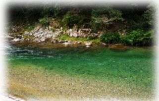
碧い清流 源流からの 贈り物

午前11時から ・あまご 100匹 人口川で放流・掴み取り・バーベキューで塩焼き