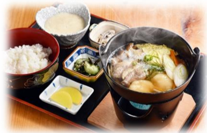
おすすめメニュー