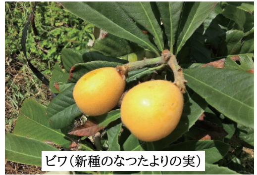
ピワ(新種のなつたよりの実)