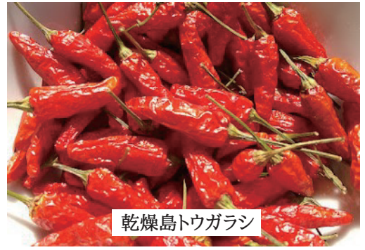
乾燥島トウガラシ